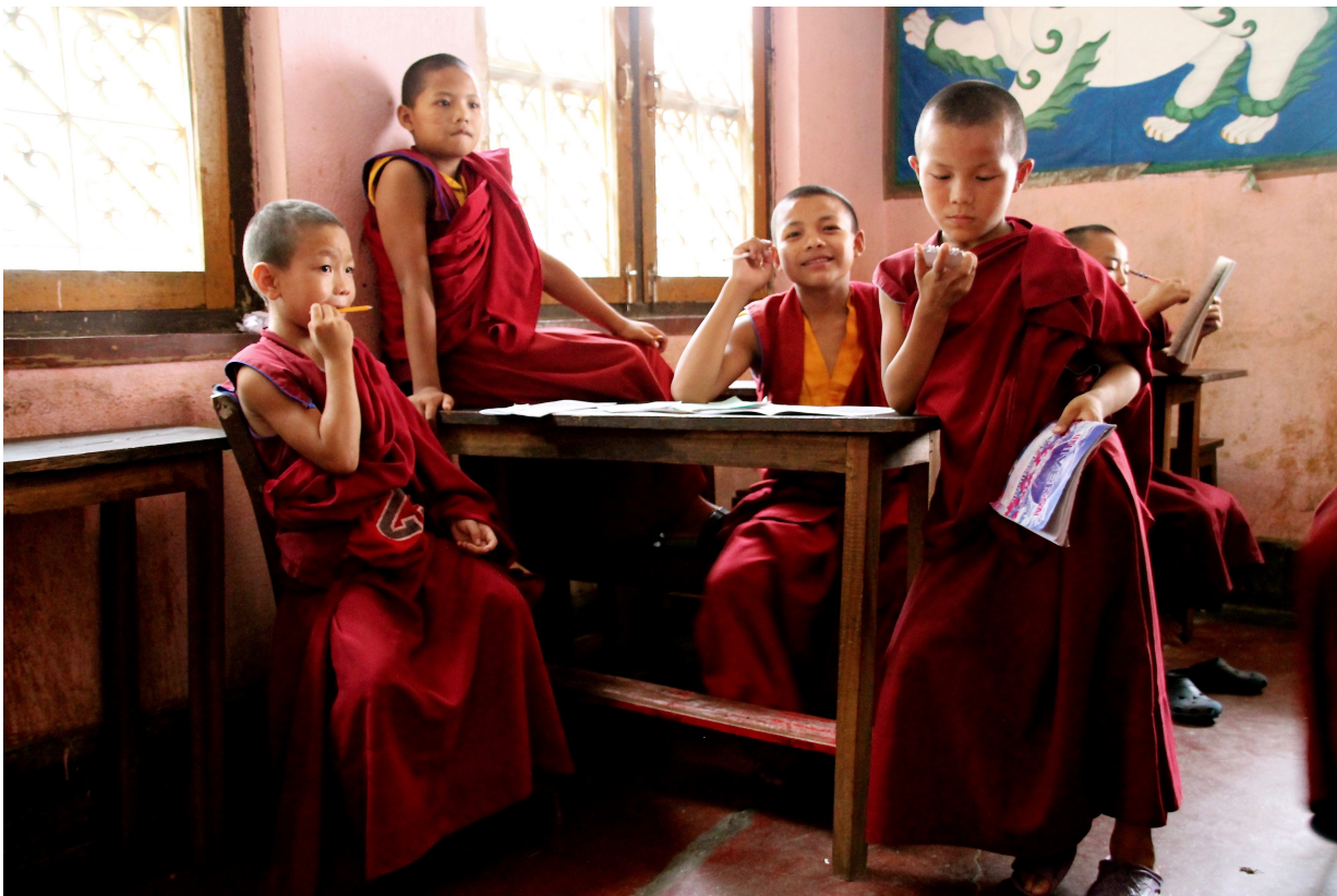
Englischunterricht im Inneren des Gadenjamghon Ling Kloster, Credit: Sophia Maier

Sie haben einfach keine Angst davor, etwas von der Welt zu verpassen, die vor den Klostermauern liegt. Sie sind eins mit sich. Sie sind eins mit dem, was übrig bleibt, wenn sie Erwartungshaltungen von außen und den Selbstverwirklichungsdrang abstreifen.