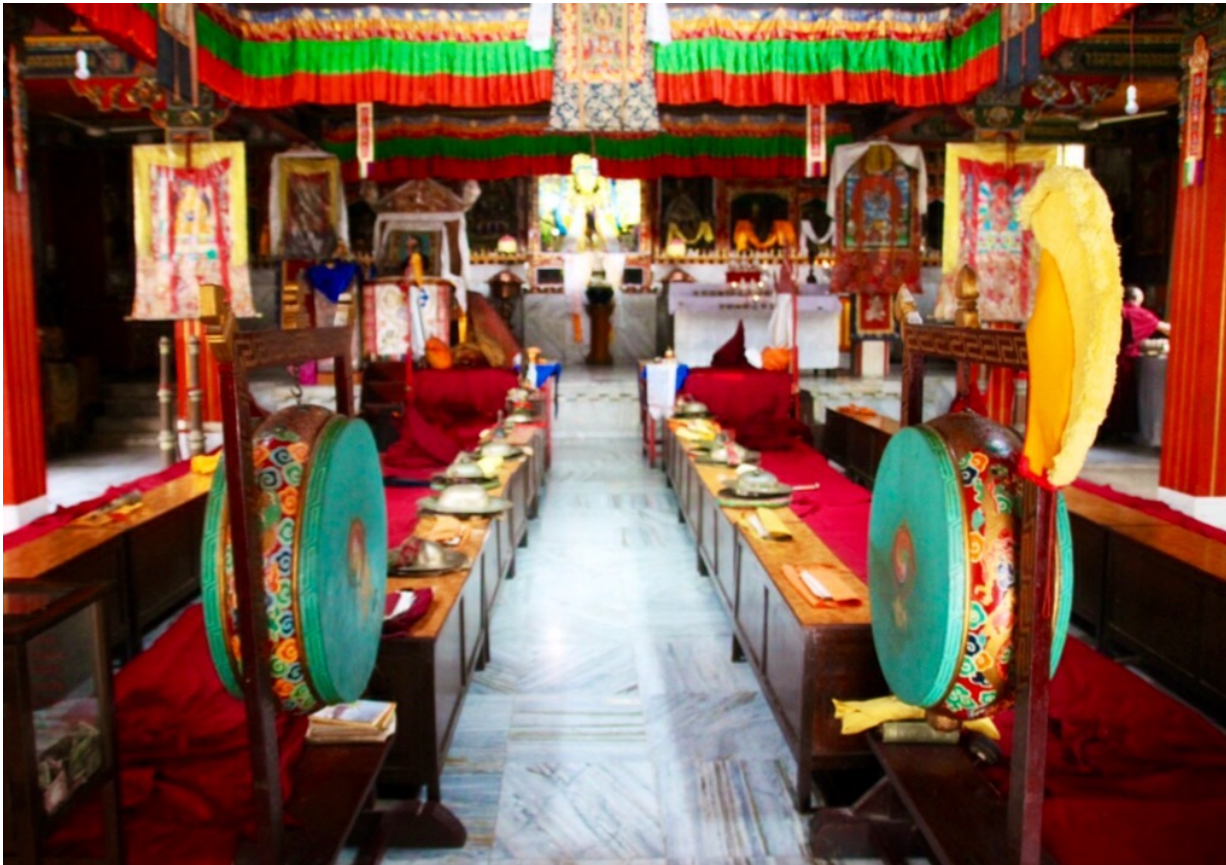
Innenraum der Gadenjamgon Ling Kloster, Kathmandu

Ja, während der gemeinsamen Gebete schaffte ich es, alle bedrückenden Gedanken hinter mir zu lassen und mich von kräftezehrenden Sorgen loszusagen. Ich existierte nur im Augenblick. Mein Körper wippte langsam, während ich den Trommeln und Glocken lauschte, die ihre Gebete begleiteten. Ich lebte ganz und gar im Moment.