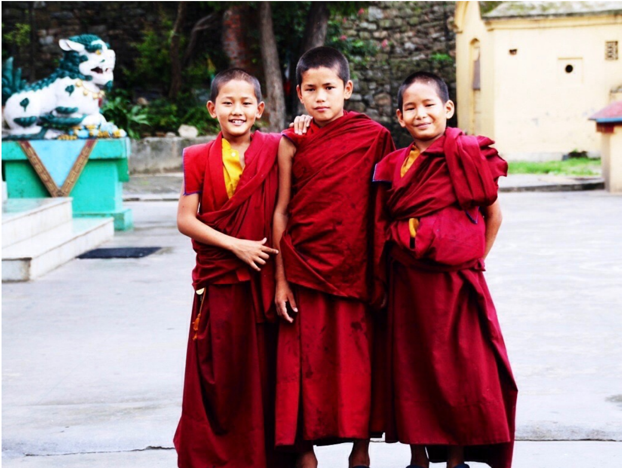
Drei Kindermönche auf dem Vorplatz des Gadenjamghon Ling Klosters

Die festen Strukturen geben ihnen die Kraft, die sie jeden morgen lächeln lässt, wenn sie mit Elan und Zuversicht in den Tag starten. Und sie geben ihnen die Ruhe und Gelassenheit, jeden Abend mit einem freien Kopf einzuschlafen und in einer erholsamen Nacht Energie für den kommenden Tag zu sammeln.