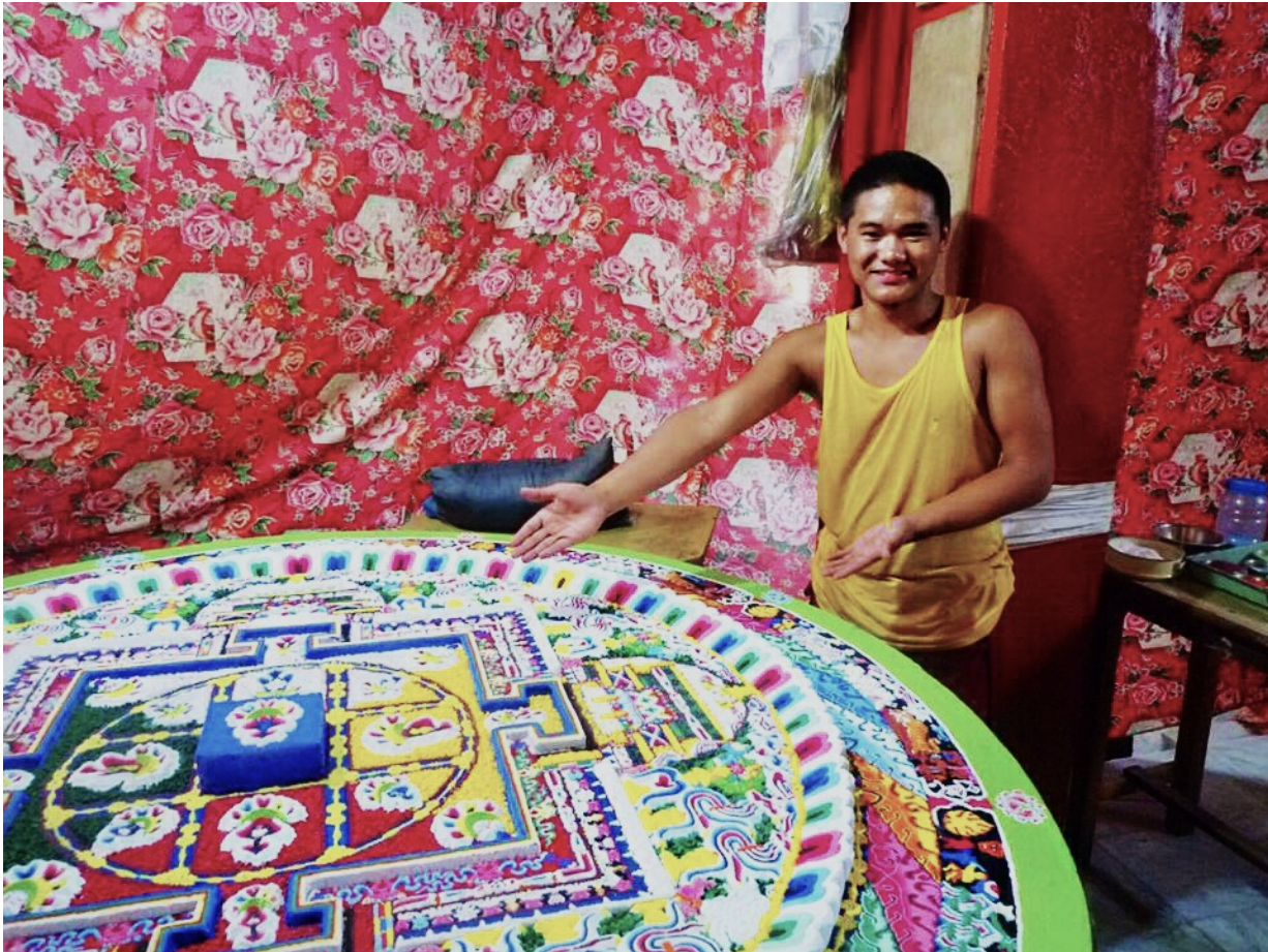
Vollendetes Mandala im Gadenjamghon Ling Klosters

Warum? Sie wollen sich erinnern, dass alles vergänglich ist. Sie wollen spüren, dass materielle Dinge genauso wie wir selbst unbeständig sind. Sie wollen ihr Herz davon lossagen - so lange, bis es ihnen keinen Schmerz mehr bereitet.